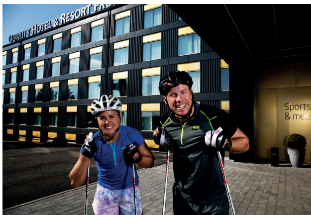
Anna Haag och Emil Jönsson

Till de anläggningar med vilka vi slutit s k ”sponsoravtal” kan vi nu lägga Frösö Park i Östersundsområdet. Frösö Park ligger som namnet anger ute på Frösön, cirka en halvmil från Östersunds centrum och profilerar sig som en anläggning med fokus på aktiv avkoppling och med längdskidåkning på programmet. Man har till sig knutit våra svenska elitskidåkare Anna Haag och Emil Jönsson som sedan en tid tillbaka bor ute på Frösön. Båda är ju skidåkare på toppnivå och ska medverka som ”hustränare” och mentorer och naturligtvis bidra till ett uppsving för anläggningen. För oss som VL-veteraner erbjuder Frösö Park i det nu nytecknade avtalet en rabatt på 15 % på ordinarie priser på logi inklusive frukost. Vi önskar Frösö Park lycka till med sin satsning!