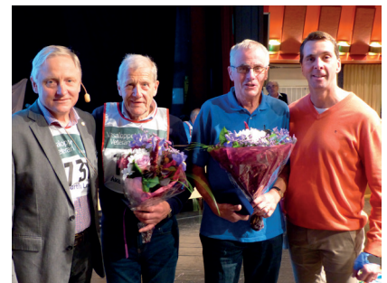
Stolta och glada 50-loppare med blomster