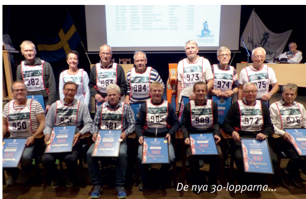
De nya 30-lopparna...