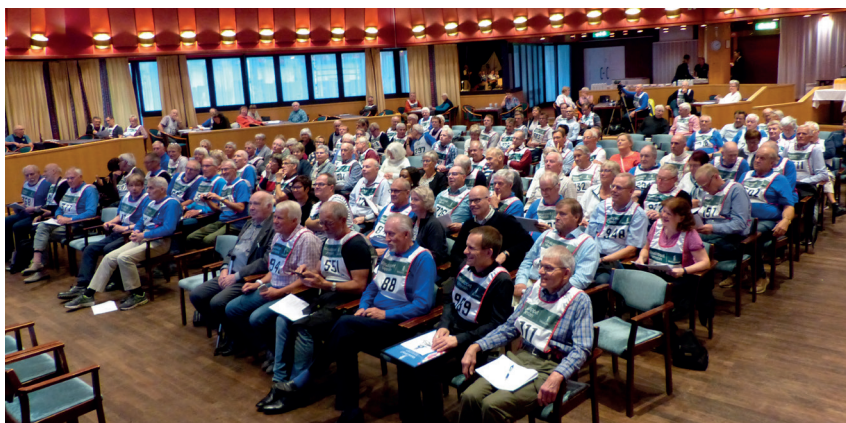
Årsmötet på Moraparken 2017