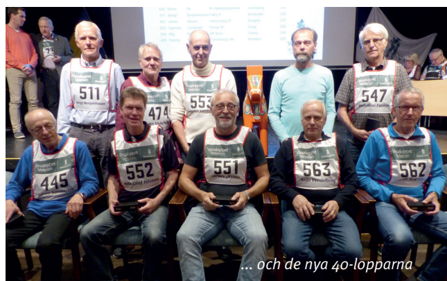
... och de nya 40-lopparna