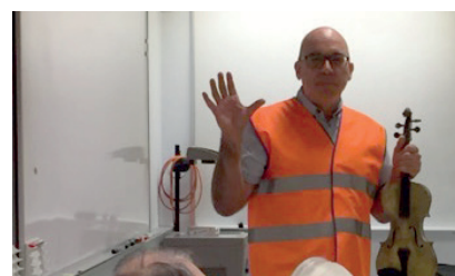
Fiolspelande guide på FM Mattsson

Nya profilkläder för Veteranklubben visades på årsmötet och kunde beställas under kvällen, beställningen är nu stängd och öppnar igen till Vinterveckan 2018. De äldre modellerna har utgått, de nya plaggen är av modernare snitt och material. Vasaloppet har förmedlat kontakter med sin sponsor Craft och gett oss veteraner förmånliga villkor. Mer information finns på hemsidan.